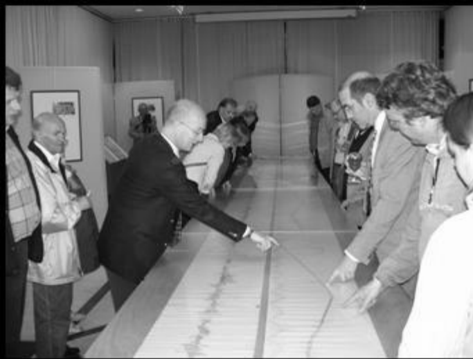
7 mei 2004 - Opening tentoonstelling Van Rijksweg tot N50 in de bibliotheek. De tentoonstelling werd ingeleid door