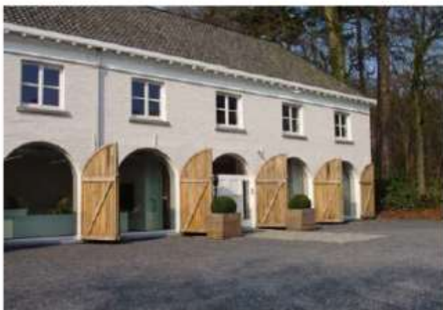
nl. 22 Het koetsgebouw met zijn indrukwekkende inrijpoorten na de geslaagde restauratie