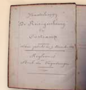
Verslagboek Reizigerskring ▲

Informatie over openbare gebouwen, kerken, bedrijven, straten, kastelen, parochies, notariaat, verenigingen, personen en gebeurtenissen kan je in ons documentatiecentrum terugvinden. Dankzij schenkingen kunnen we de gevarieerde verzameling steeds uitbreiden. Daarnaast hebben we een uitgebreide bibliotheek met publicaties en tijdschriften, aansluitend bij deze onderwerpen. Via de Beeldbank kunnen we een goed ontsloten fotoarchief aanbieden.