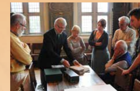
▲ Bezoek aan het archief van de St.-Sebastiaansgilde in Brugge

HKO organiseert jaarlijks enkele activiteiten (Wiekebabbel, fietstocht, wandeling, deelname aan Open Monumentendag, Erfgoeddag, Nacht van de geschiedenis, geleide bezoeken aan een tentoonstelling, archief of optreden...) waarop zowel leden als niet-leden welkom zijn. Leden kunnen gratis of aan een voordeeltarief deelnemen.