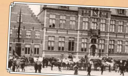
Prijsveekamp op het Gemeenteplein ▲

De beeldbank is een grote fotoverzameling die via internet kan geraadpleegd worden. Deze beelden worden door een werkgroep van HKO ingescand en beschreven. De originele foto's gaan terug naar de eigenaar. Vervolgens worden ze (mits toestemming van de eigenaar) online voor het brede publiek ter beschikking gesteld. Het gaat hier – voor alle duidelijkheid – om beelden met een publiek karakter (verenigingen, gebeurtenissen, straatzichten, gebouwen, markante figuren). Je vindt deze foto's terug op www.beeldbankwest-vlaanderen.be .