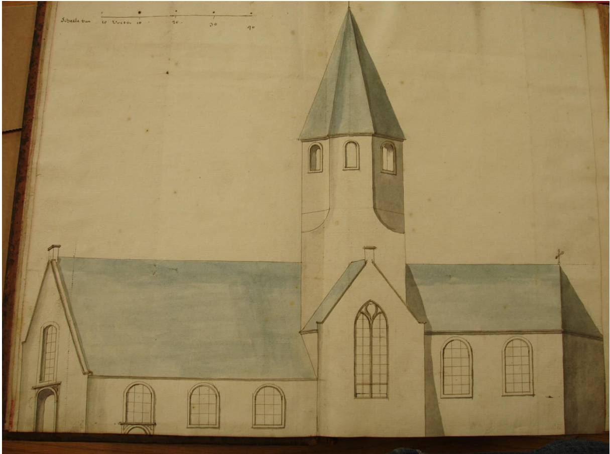
Afbeelding van de Sint-Pieters-in-de-Bandenkerk in de ommeloper van 1721